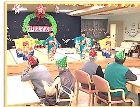
■園児との ふれあい

『お話がしたい…』『お風呂に安心して 入りたい…』『楽しく体を動かしたい…』 思いをかなえ、また来なくなるデイサービス を心がけています。皆様をお待ちしています。