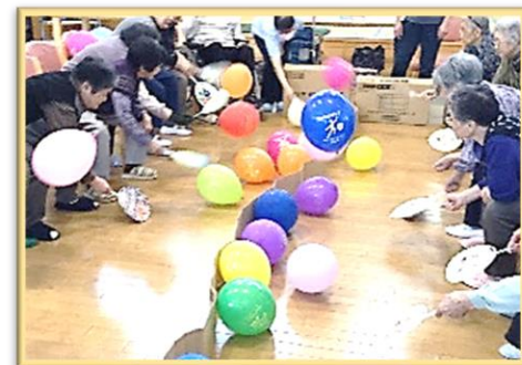
■レクリエーション(風船バレーゲーム)