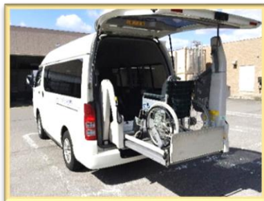
■車いす対応車 での送迎

『お話がしたい…』『お風呂に安心して 入りたい…』『楽しく体を動かしたい…』 思いをかなえ、また来なくなるデイサービス を心がけています。皆様をお待ちしています。