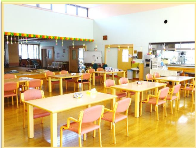
■明るく開放感のあるホール