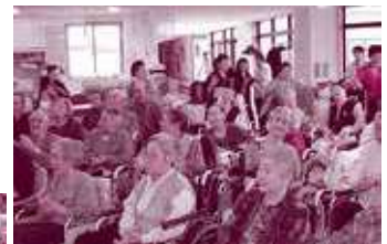
皆さん真剣です！ 歌に踊りに大満足です！