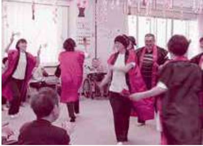
4月から新たに加わった職員も 息の合った踊りを披露し、利用者の 皆さんのお誕生日をお祝いしました!!

新年度を迎えて平館通所介護事業所もさらに パワーアップ！毎日が特別な日になりますよ！