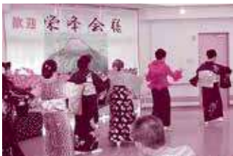
栄峰会の皆さん いつもありがとうございます！

5月18日に栄峰会の皆さんがあんじんの郷へ慰問にお越しくださいました。皆さんの可憐な姿に利用者の皆さんも見入ってしまいました。ありがとうございました。