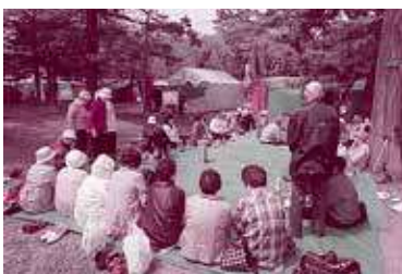
ボランティアの皆さん いつもありがとうございます！

4月30日に蟹田・平舘・三厩地区の75歳以上のひとり暮らしの方々を対象にした花見会が青森市の合浦公園にて開催されました。当日は晴天に恵まれ、40名を超える参加者の皆さんが桜の木の下で一緒にお弁当を食べ、話にも華が咲き、大変賑やかな会となりました。その後はラ・セラ東バイパスへ買い物へ行き、皆さん思い思いの買い物を楽しまれました。