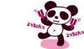
踊りの輪に飛び入りで 参加された利用者の方も いらっしやり、おおいに 盛り上がった誕生会でした。