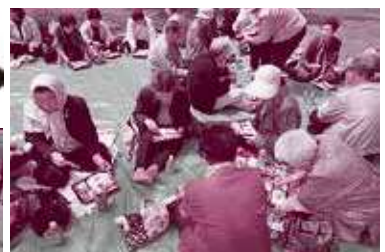
次回は7月上旬に開催予定です。 皆さんのご参加お待ちしております！