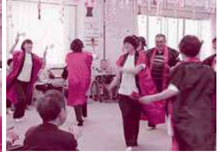
利用者の皆さんが笑顔だと 自然と職員も笑顔が満開です。 このキラのあるステップ^^v